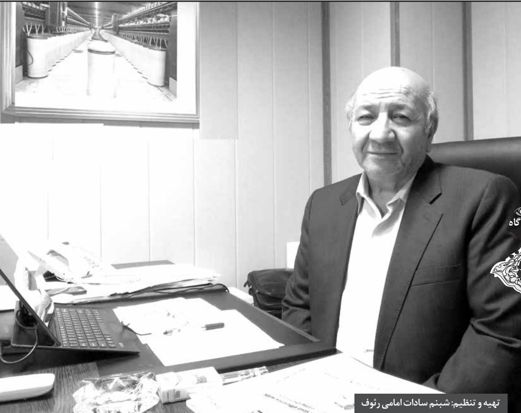
تهیه و تنظیم: شبینم سادات امامی رئوف

وی با اطمینان اعلام می‌کند که صنعت نساچی زیان‌ده نبوده و نیست و سپس تغییر نگرش مسئولان نسبت به تولید و صنعت را ضروری می‌داند و می‌افزاید: «مسئول دو تابعیتی که برایش مهم نیست چه اتفاقاتی برای صنعت و اقتصاد کشور رخ می‌دهد و در صورت بروز کوچک‌ترین مشکل، به خارج از کشور مهاجرت می‌کند؛ نباید چنین افرادی در رأس امور کشور قرار گیرند.» متن کامل این گفت‌وگو از نظر تان می‌گذرد: